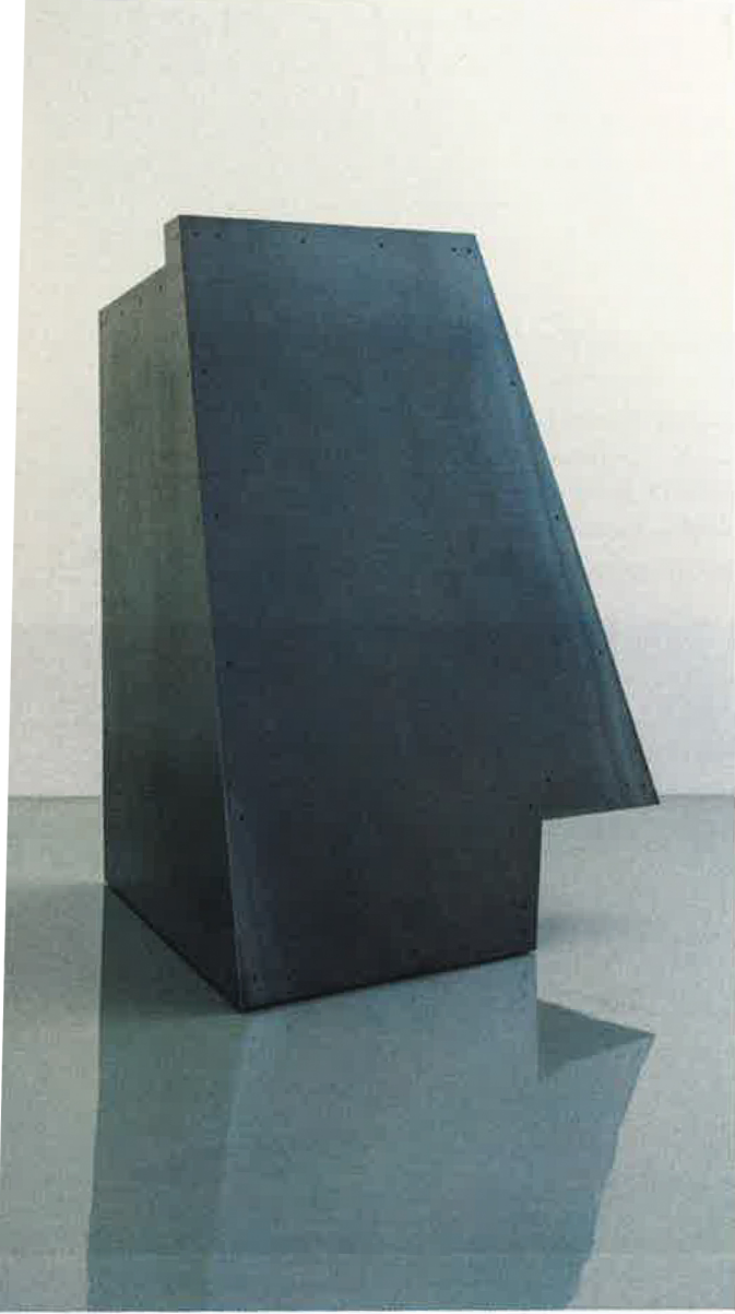
Mike Berg Piramit 2024 Çelik heykel 150x150x160 cm Foto: Zeynep Fırat

manı hem mekânı hem çeperi hem merkezi işaret ediyorsa kamu, kamusal alan ve kamusal sanat da farklı cümlelerde farklı öğeler olarak izleyicinin karşısına çıkabiliyor. “Nasıl” sonsuz tekrar eden bir soru olarak hiç durmadan yanıtını arıyor. Berg’ün işleri gerek kendi aralarında kurdukları ilişkiler gerek sergi düzeniyle yaratıkları yeni etkileşimlerle gerekse sergi mekânının İstanbul’daki konumunun potansiyelleriyle dikkat çekiyor. Sahi “(Biz) buraya (Sultanbeyli’ye, İstanbul’a, dünyanın ya da bu metnin sonuna) nasıl geldik?”